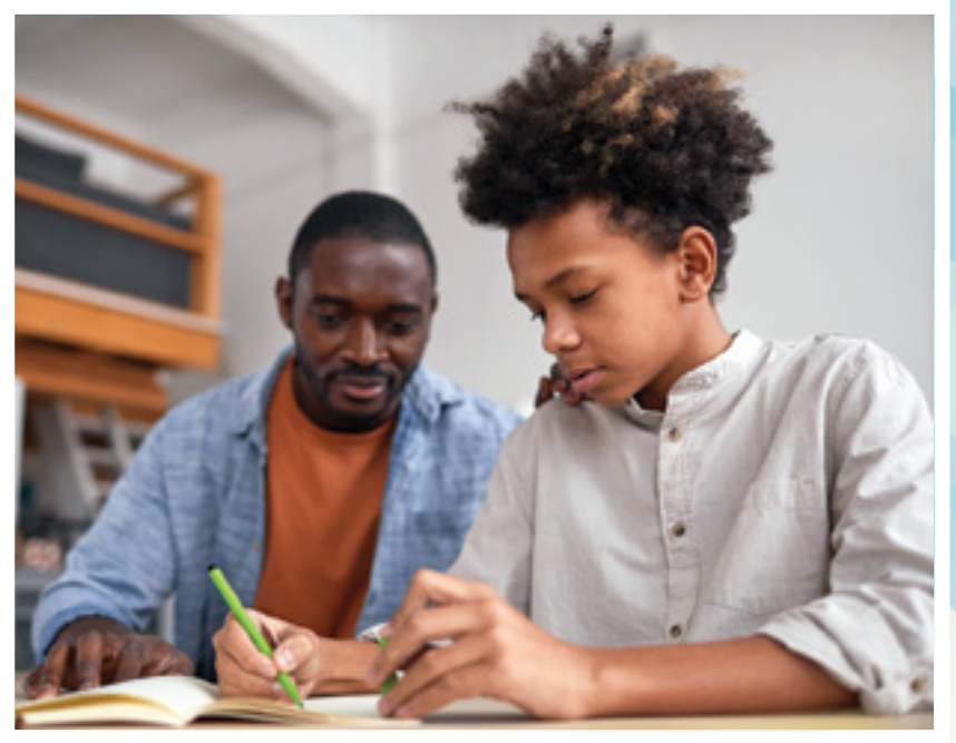
Macluumaadkani ku jira buug-yarahaan waa hadda waqtigii la daabacay. Federaalka, dowlada iyo sharciyadda deegaanka saameyn ayay ku yeelan karaan wargelinadda qorshooyinka degmada iyo hannaankooda, iyo caddaka ugu dambeeyay ee hadda ah waxaa laga heli karaa www.fwps.org .