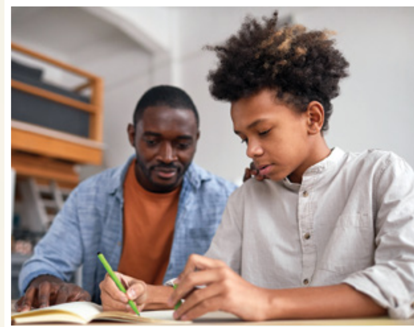
Macluumaadkani ku jira buug-yarahaan waa hadda waqtigii la daabacay. Federaalka, dowlada iyo sharciyadda deegaanka saameyn ayay ku yeelan karaan wargelinadda qorshooyinka degmada iyo hannaankooda, iyo caddaka ugu dambeeyay ee hadda ah waxaa laga heli karaa www.fwps.org .