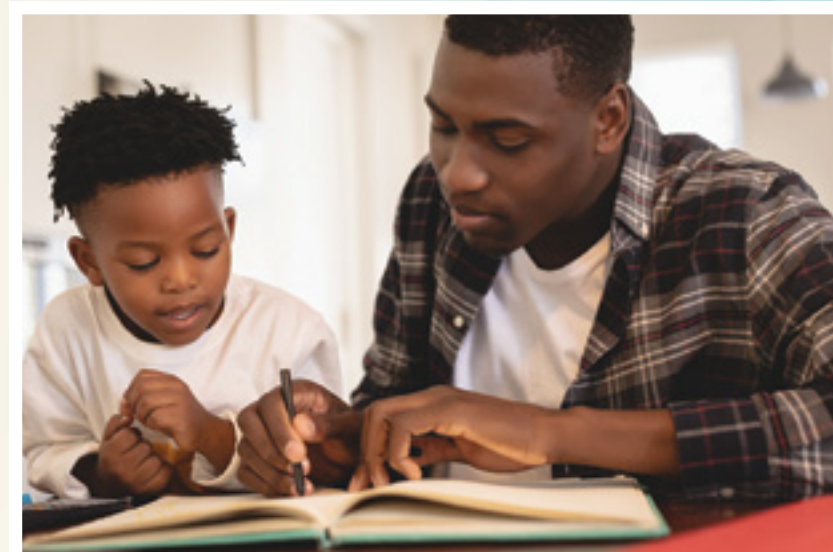
Macluumaadkani ku jira buug-yarahan waa hadda waqtigii la daabacay. Federaalka, dowlada iyo sharciyadda deegaanka saameyn ayay ku yeelan karaan wargelinadda qorshooyinka degmada iyo hannaankooda, iyo caddaka ugu dambeeyay ee hadda ah waxaa laga heli karaa www.fwps.org .